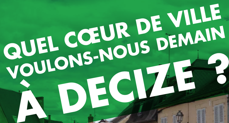
Table ronde citoyenne n°1 - relevé d'échanges

44 participants - mardi 6 octobre 2015 de 18h à 20h